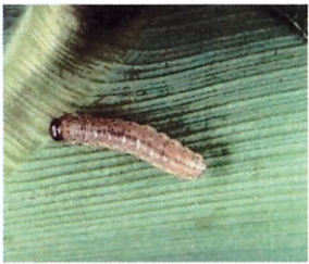
Ang Mapaminsalang Asian Corn Borer

Ang Asian Corn Borer (ACB), Ostrinia furnacalis ay isa sa pinakamapaminsalang insekto sa maisan. Ang mga ito ay nagsisimulang maminsala apat (4) na linggo matapos makatanim hanggang sa makapag-ani. Ang pinakamapaminsalang yugto ng buhay ng corn borer ay kung ito ay nasa anyong uod. Maaaring bumaba ang ani ng mais mula 20-80 %.